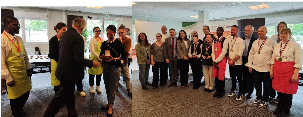
Remise de la Médaille SMLH à la Responsable du Groupe .....L'ESAT Berthier, vainqueur de la 1 ère étape régionale, en lice pour la finale