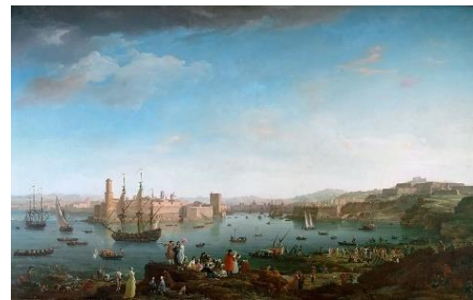
Port de Marseille par Joseph Vernet en 1754

Sa consommation s'étend rapidement dans la cité phocéenne mais déclenche une « dispute publique » parmi les savants et médecins de la Faculté d'Aix-Marseille : le café qu'ils prescrivaient en tant que médicament leur échappe, ils s'efforcent alors de le dénigrer auprès de la population, mais trop tard !!