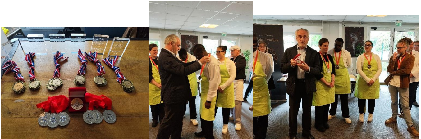
Les Médailles pour les gagnants des différentes épreuves.....Remise des Médailles de la SMLH par D de la Rochefoucault pour « cohésion d'équipe »