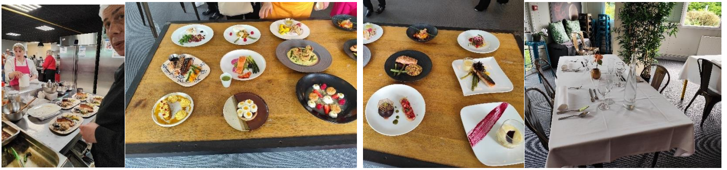
Préparation en cuisine,.....Présentation des entrées, plats et desserts des cinq équipes en lice.....Mise en place d'une table.....