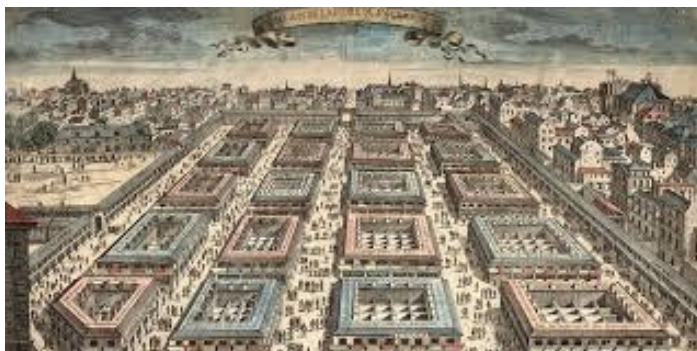
De la Foire de Saint Germain (BNF) ...au Procope

En 1672, il transforme l'une des 140 échoppes de la Foire Saint Germain en une « boutique à caoua » à 6 deniers la tasse. Les « loges » du Faubourg Saint Germain étaient des espaces de vente qui abritaient des commerces ou des spectacles forains jusqu'à la Révolution.